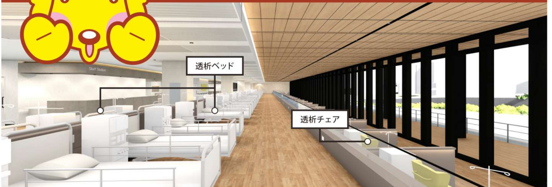
▲画像：新病院 2階透析室 (内観パース図より) ▲イラスト：マスコットキャラクター「ハッピー」