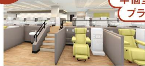
◀透析チェアのコーナー (内観パース図より)