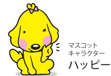
マスコット キャラクター ハッピー

職員の健康・優しさ・やりがいを追求し、 患者さんの元気・明るさ・生きがいへと繋がります